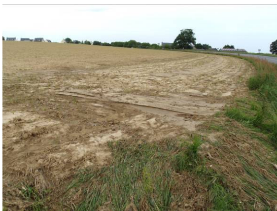
Photo d'une parcelle du bassin du Général en mai 2011 suite aux violents orages.

On les retrouve souvent en quantité énorme dans les cours d'eau parce que les doses nécessaires à leur efficacité sont élevées, et qu'un orage sur sol sec entraîne leur ruissellement vers les cours d'eau.